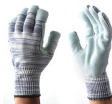
NS1900112 GUANTES DYNEEMA® LEATHER-POLYESTER, PUÑO CERRADO, NIVEL DE CORTE No 5, PALMA Y PUNTA DE DEDOS CUBIERTAS DE CUERO, COLOR GRIS. TALLA 9.