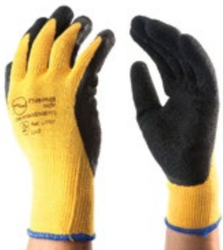
NS1400111 GUANTES CRINKLE LÁTEX, PUÑO EN ALGODÓN, PALMA CUBIERTA DE NS1400112 LÁTEX NATURAL, COLOR NEGRO CON NS1400113 AMARILLO. TALLAS 8, 9, 10.