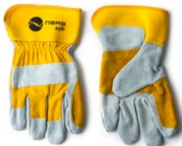
NS1100402 GUANTES CARNAZA DRIL 10.5" CON REFUERZO, COLOR AMARILLO CON BLANCO.