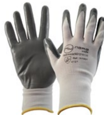
NS1210110 GUANTES NARAFLEX DE NYLON BLANCO, NS1210111 RECUBIERTO EN NITRILÓ EN LA PALMA, NS1210112 PUÑO CERRADO, COLOR BLANCO CON NS1210113 GRIS. TALLA 7, 8, 9