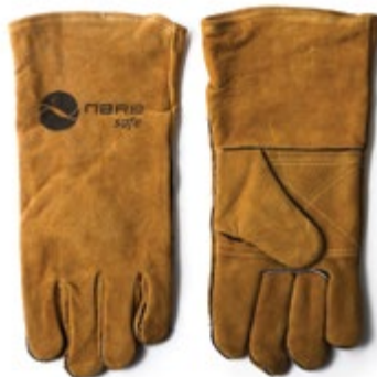
NS1100212 GUANTES CARNAZA SOLDADOR 14" COSIDO EN KEVLAR REFORZADO EN LA PALMA, COLOR MARRÓN.