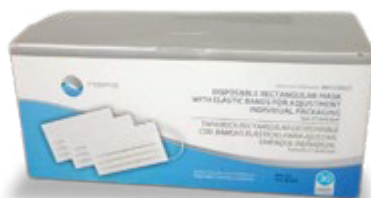
NA7100102 TAPA BOCA RECTANGULAR DESECHABLE, CAJA DE 30 UNIDADES, EN EMPAQUE INDIVIDUAL