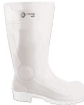
BOTAS BULLDOZER BLANCA, REFORZADA EN PUNTA Y TALÓN.