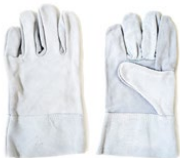
NS2700112 GUANTES CARNAZA PALMA Y DORSO, PUÑO ABIERTO, COLOR GRIS.