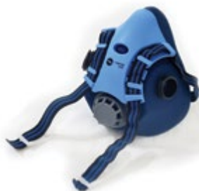
NA7200300 RESPIRADOR REUSABLE, EN SILICONA, MEDIA CARA, DOBLE FILTRO. TALLA ÚNICA. CE EN 140:1998 / CE EN 14387:2004