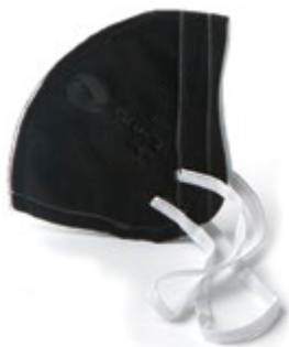
NA7100002 MASCARILLA PAQUETE DE 5 NA7100003 UNIDADES COLORES NEGRO, NA7100004 BLANCO Y AZUL.