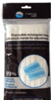
NA7100111 TAPABOCA RECTANGULAR DESECHABLE, PAQUETE DE 10 UNIDADES