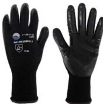
NS1500111 GUANTES TÁCTIL NITRILÓ - NYLON NS1500112 NITRILÓ, PUÑO ELÁSTICO CERRADO, NS1500113 COLOR NEGRO. TALLA 8, 9, 10.