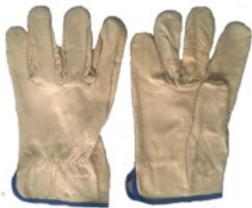
NS1100303 GUANTES TIPO INGENIERO 100% CUERO, COLOR BEIGE.