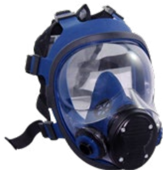
NA7200500 RESPIRADOR REUSABLE, EN SILICONA, FULL FACE, DOBLE FILTRO. TALLA ÚNICA. CE EN 136:1998 / CE 14387:2004 +A1: 2008.