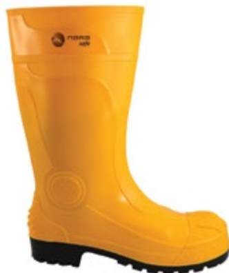
BOTAS BULLDOZER AMARILLA, REFORZADA EN PUNTA Y TALÓN.