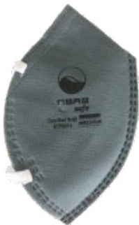
NA7110015 RESPIRADOR FABRICADO BAJO EL ESTÁNDAR N95, CARBÓN ACTIVADO, PAQUETE DE 5 UNIDADES, COLOR GRIS.