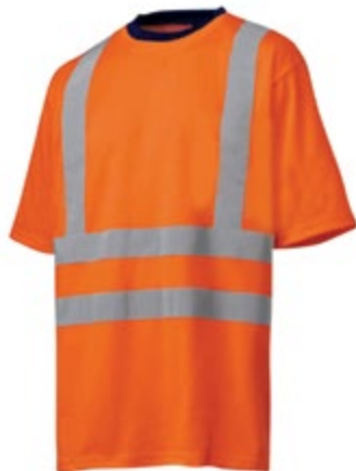
NA5300112 CAMISETA REFLECTIVA MANGA NA5300113 CORTA, COLOR NARANJA. NA5300114 TALLA M, L, XL