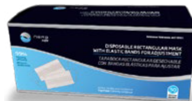
NA7100101 TAPABOCA RECTANGULAR DESECHABLE, CAJA DE 50 UNIDADES