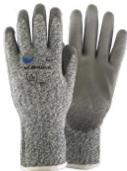
NS2610111 GUANTES CUT RESISTENT, NS2610112 RECUBRIMIENTO EN PU, NS2610113 NIVEL DE CORTE 5, COLOR GRIS . TALLA 8, 9 y 10.