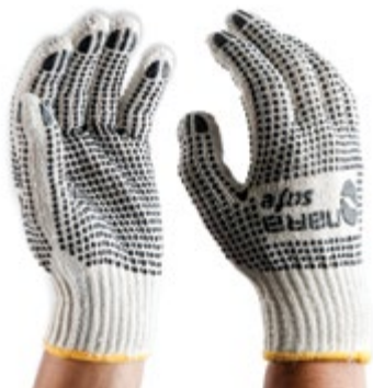
NS2400111 GUANTES COTTON PVC DOTS COLOR BLANCO CON PUNTOS NEGROS.