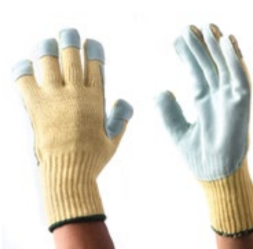
NS1800112 GUANTES KEVLAR LEATHER-POLYESTER, PUÑO CERRADO, NIVEL DE CORTE No 4, PALMA Y PUNTA DE DEDOS CUBIERTAS DE CUERO, COLOR AMARILLO CON GRIS. TALLA 9.