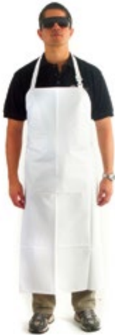
NI5100015 DELANTAL 0.82 x 1.15 m CALIBRE 16, COLOR BLANCO.