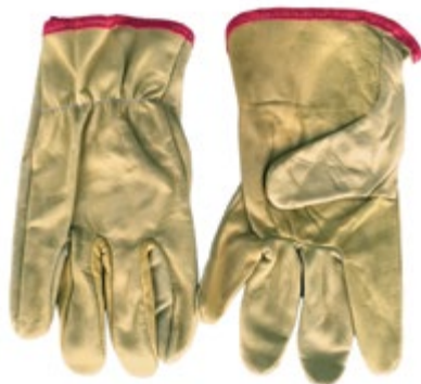
NS1130003 GUANTES VAQUETA INGENIERO SENCILLO, COLOR AMARILLO CLARO.