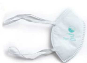
NA7100012 RESPIRADOR FABRICADO BAJO EL ESTÁNDAR NA7100013 N95, PAQUETE DE 5 UNIDADES, COLORES NEGRO Y BLANCO.