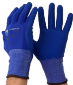
NS1220111 GUANTES BLUE SUPER FLEX NYLON, NS1220112 NITRILÓ, PU, PUÑO CERRADO, NS1220113 COLOR AZUL. TALLA 8, 9, 10.