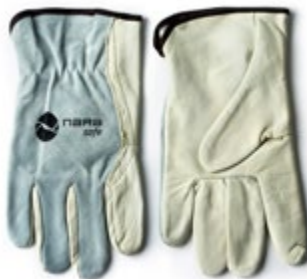
NS1100302 GUANTES TIPO INGENIERO DE CUERO, COLOR BLANCO.