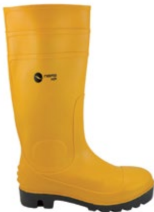
BOTAS PVC, PUNTERA REFORZADA, SUELA NEGRA, COLOR AMARILLO.