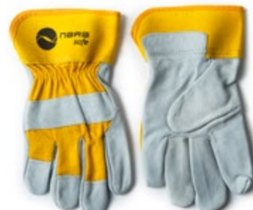
NS1100502 GUANTES CARNAZA DRIL 10.5", COLOR AMARILLO CON BLANCO.