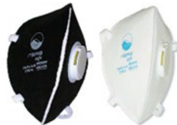
NA7110012 RESPIRADOR FABRICADO BAJO EL ESTÁNDAR NA7110013 N95, CON VÁLVULA, PAQUETE DE 5 UNIDADES, COLORES NEGRO Y BLANCO.