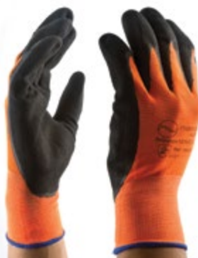
NS1600110 GUANTES SANDY POLYESTER NS1600111 LÁTEX, COLOR NEGRO CON NS1600112 NARANJA. TALLAS 7,8,9,10. NS1600113