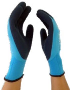
NS2900111 GUANTES NYLON-COOL®, DOBLE NS2900112 RECUBRIMIENTO DE LÁTEX PALMA Y DORSO, PUÑO CERRADO, COLOR AZUL. TALLAS 8 Y 9.