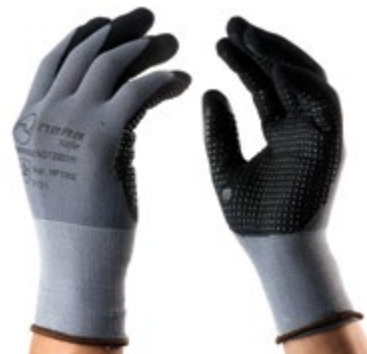
NS1200111 GUANTES SUPER FLEX NITRILÓ - NYLON NS1200112 NITRILÓ, PUÑO CERRADO, COLOR GRIS NS1200113 CON NEGRO. TALLAS 8, 9, 10.