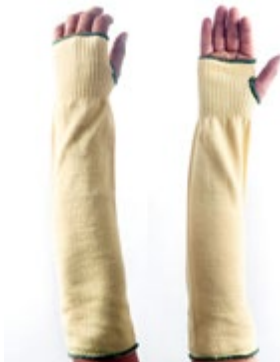
NS2200112 MANGA SLEEVES DE FIBRA DE KEVLAR DE 45 cm, COLOR AMARILLO