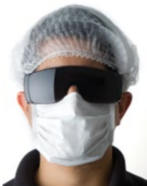
NS9100111 GORRO PLEGADO. BOLSA DE 100 UNIDADES