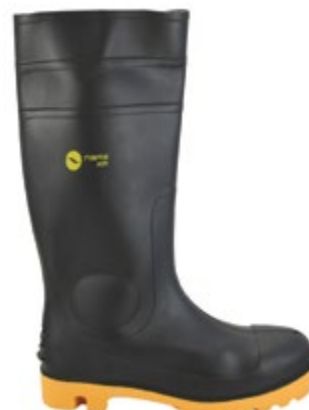
BOTAS PVC, PUNTERA REFORZADA, SUELA AMARILLA, COLOR NEGRO.