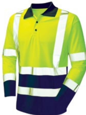
NA5400112 CAMISETA TIPO POLO NA5400113 REFLECTIVA MANGA LARGA, NA5400114 COLOR NEÓN CON AZUL OSCURO. TALLA M, L, XL