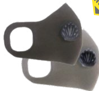
NA7230022 RESPIRADOR REUSABLE SPANDEX NA7230020 CON VÁLVULA, COLORES NEGRO Y GRIS.