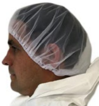
NI5100218 GORRO MALLA REDONDO BLANCO