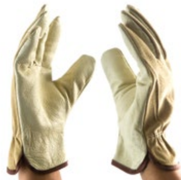
NS1100603 GUANTES DE INGENIERO PIG GRAIN, DORSO DE CUERO DE CERDO, COLOR AMARILLO CLARO.