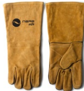
NS1100122 GUANTES CARNAZA SOLDADOR 16" COSIDO EN KEVLAR REFORZADO EN LA PALMA, COLOR MARRÓN.