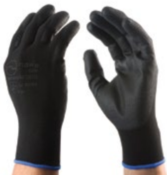
NS1700110 GUANTES CONFORT PU NS1700111 NYLON POLIURETANO, PUÑO CERRADO, NS1700112 COLOR NEGRO. NS1700113 TALLA 7, 8, 9, 10