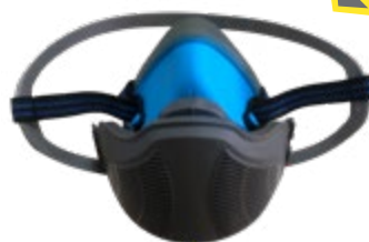
NA7200700 RESPIRADOR REUSABLE, EN SILICONA, MEDIA CARA, NARA BÁSICO, PARA MATERIAL PARTICULADO. TALLA ÚNICA.