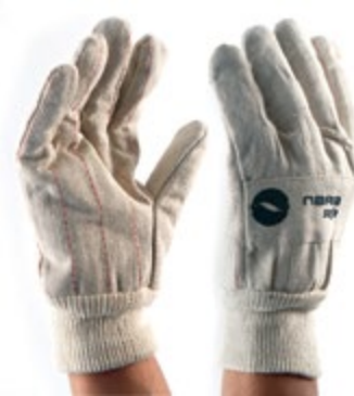
NS2500111 GUANTES PETOLERO, PUÑO CERRADO, 100% ALGODÓN, COLOR BLANCO.