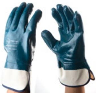
NS1300112 GUANTES HEAVY DUTY NITRILLO, PUÑO NS1300113 ABIERTO - ALGODÓN NITRILLO, COLOR AZUL CON BLANCO. TALLA 9, 10