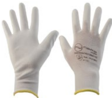
NS1260110 GUANTES NYLON PU, NS1260111 POLIURETANO, PUÑO CERRADO NS1260112 COLOR BLANCO. TALLA 7, 8, 9