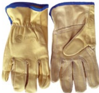
NS1130005 GUANTES VAQUETA INGENIERO REFORZADO, COLOR AMARILLO CLARO.