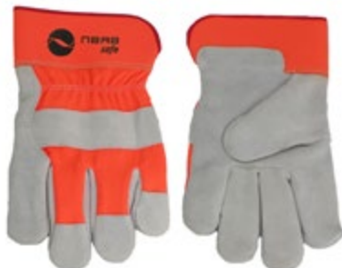
NS1100503 GUANTES CARNAZA DRIL 10.5", COLOR NARANJA