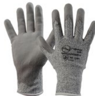
NS2600111 GUANTES CUT RESISTENT, NS2600112 RECUBRIMIENTO EN PU, NIVEL DE CORTE 3, COLOR GRIS . TALLA 8, 9