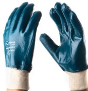
NS1300212 GUANTES HEAVY DUTY NITRILLO, NS1300213 PUÑO CERRADO - ALGODÓN NITRILLO, COLOR AZUL CON BLANCO. TALLA 9, 10.