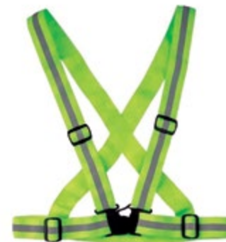
NA5200012 ARNÉS REFLECTIVO ELÁSTICO, COLOR NEÓN.