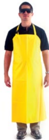
NI5100016 DELANTAL 0.82 x 1.15 m CALIBRE 16, COLOR AMARILLO.