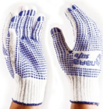
NS2300111 GUANTES POLYESTER PVC DOTS, COLOR BLANCO CON PUNTOS AZULES.