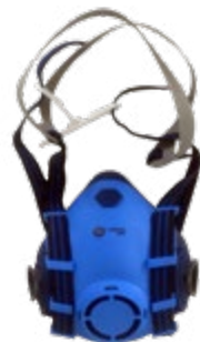
NA7200600 RESPIRADOR REUSABLE, EN SILICONA, MEDIA CARA, DOBLE FILTRO. TALLA ÚNICA. CE EN 140:1998 / CE EN 14387:2004