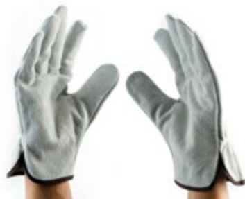
NS1100703 GUANTES INGENIERO DRIVER GLOVES, PALMA Y DORSO EN CARNAZA BLANCA PARA MAYOR RESISTENCIA. COLOR GRIS CLARO