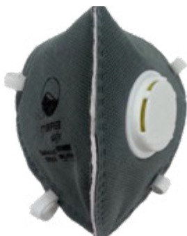
NA7110014 RESPIRADOR FABRICADO BAJO EL ESTÁNDAR N95, CARBÓN ACTIVADO CON VÁLVULA, PAQUETE DE 5 UNIDADES, COLOR GRIS.