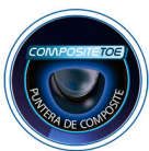
PUNTERA DE COMPOSITE